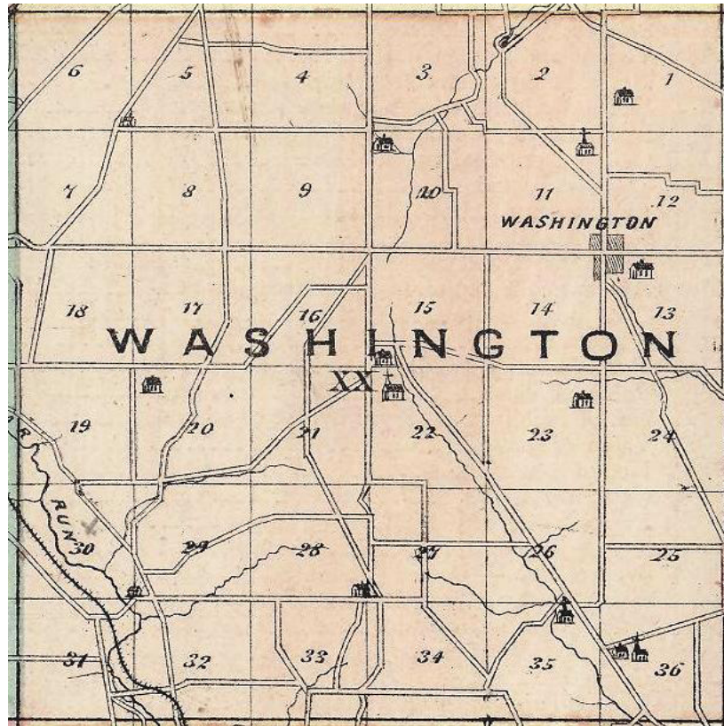
Washington Township, Ohio. Source: ATLAS MAP OF RICHLAND COUNTY, OHIO. Compiled, Drawn & Published from Personal Graminations & Surveys by A.T. Andreas. Chicago, Ill., 1873, p. 72.

The legislative response to these concerns was set out in two acts: the Land Ordinance of 1785 10 and the Northwest Ordinance of 1787. 11 The Land Ordinance of 1785 required a survey and division of western lands into townships of seven square miles with 36 sections in each township. The statute also stated that “[t]here shall be reserved for the United States out of every township, the four lots, being numbered 8, 11, 26, 29, and out of every fractional part of a township, so many lots of the same numbers as shall be found thereon,” and that “[t]here shall be reserved the lot No. 16, of every township, for the maintenance of public schools within the said township.” This brief provision provided the crucial funding mechanism for state public schools, and placed public school lands literally and figuratively in the center of the township structure. 12