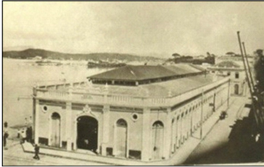
FIGURA 1. O novo Mercado Público construído em 1898