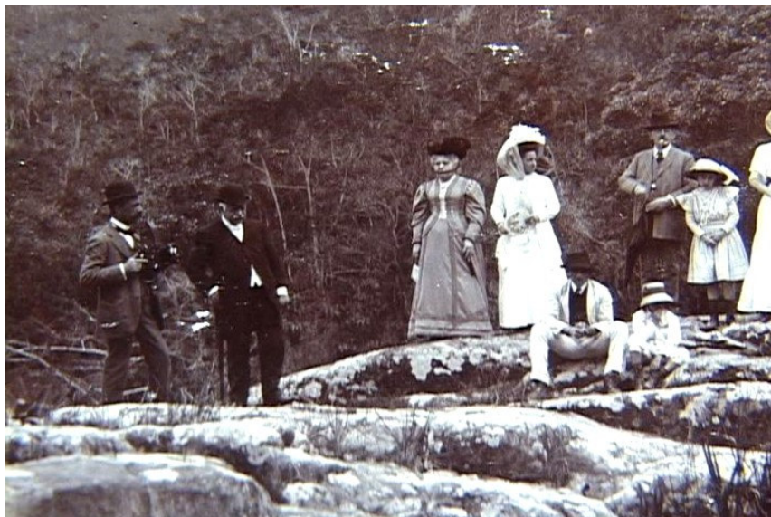
FIGURA 3. Visita às obras da primeira usina de força

Especificamente, nosso trabalho não pretende limitar-se à temática da escravidão, enquanto instituição e forma de organização do trabalho, tendo por eixo a problemática da resistência e da acomodação escrava. Nossos olhos estão na cidade de Desterro e nas experiências dos seus habitantes africanos, buscando indicar em que medida a presença africana livre, cativa ou liberta estava no centro das relações sociais que estabeleciam os contornos da configuração urbana e instituíam os papéis sociais, a distribuição de prestígio e poder e a percepção de civilidade na segunda metade no século XIX. Ao mesmo tempo, tentamos indicar a existência de soluções alternativas àquelas tomadas por parte das elites da Primeira República e entender a ação de diferentes sujeitos no momento de gestação de novos modos de viver no final do Império.