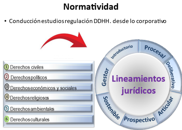
Figura 2 - Ejes de estudio normativo para la diligencia en DD.HH